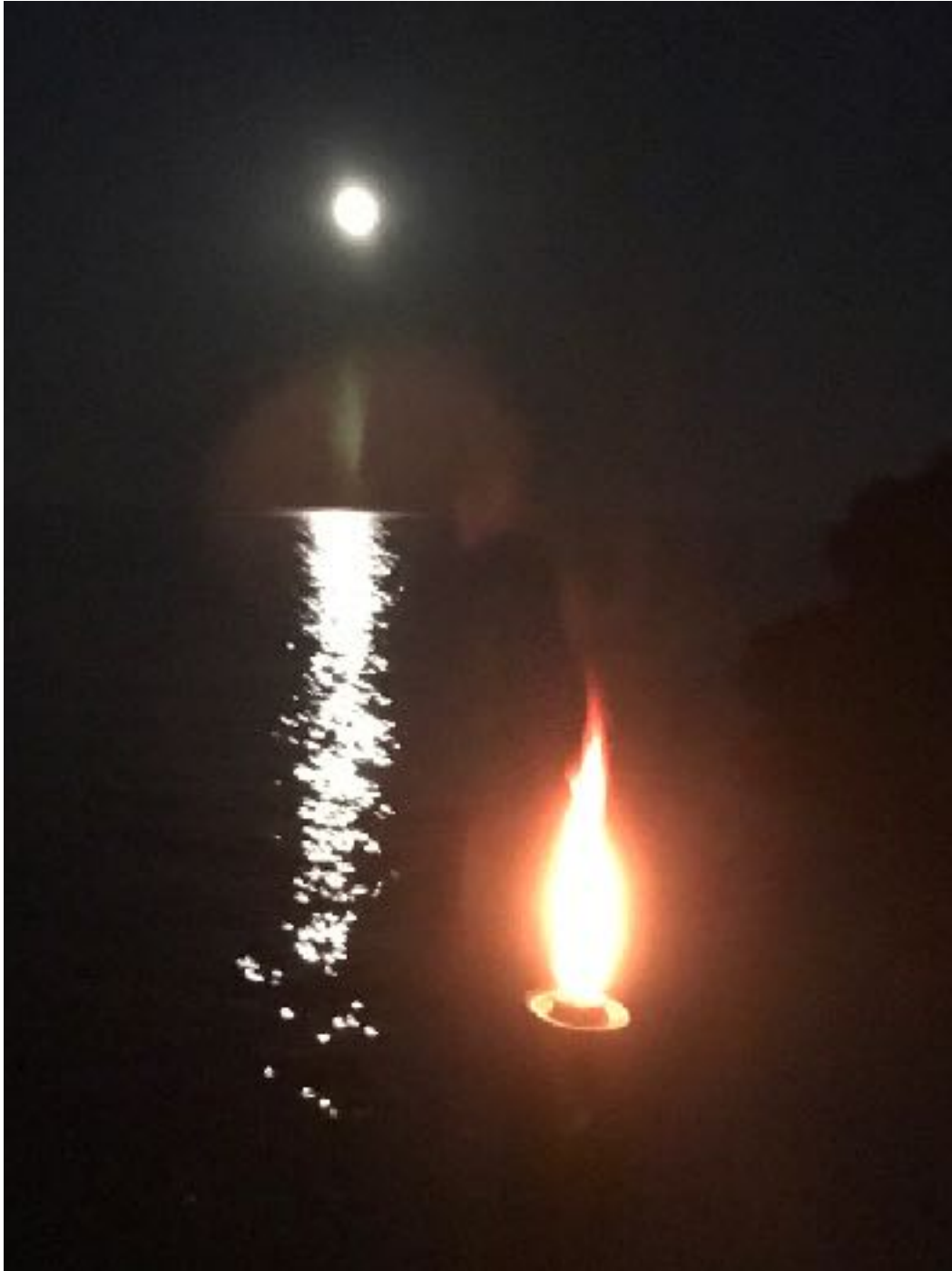
Chora Sfakion auf Kreta 克里特岛。希腊

Versuche nicht, allen Ansprüchen anderer gerecht zu werden. Denn das ist unmöglich. Du beschädigst dich bei diesem Versuch nur selbst. Eine andere Person zu einem Lächeln bewegen -, dies kann die Welt verändern. Nicht die Welt überhaupt, aber die Welt dieser Person. Deshalb: begrenze dich, achte auf deine Grenzen.