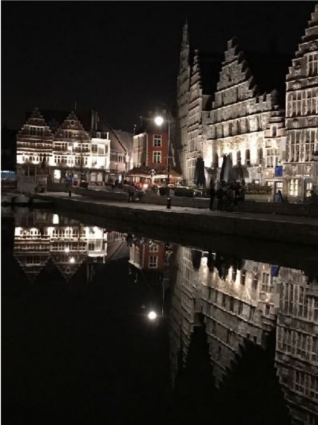
Gent (Belgien) 比利时 根特

Jeder Mensch, der dir begegnet, kann dir etwas zeigen, so oder so. Der eine will dich prüfen, ein anderer dich nur benutzen, ein dritter will dich belehren. Am vorzüglichsten aber: der andere bringt das beste in dir zum Vorschein.