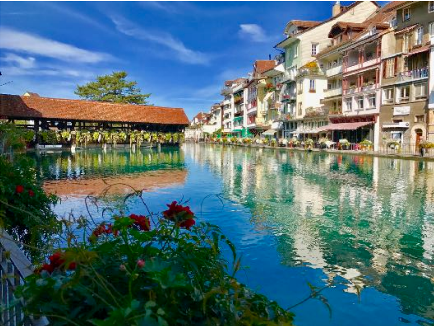
Thun Stadt 瑞士 我住图恩

Die wirkliche Welt verträgt keinen Perfektionismus; sie belohnt jene Menschen, die Dinge anpacken und zu Ende bringen.