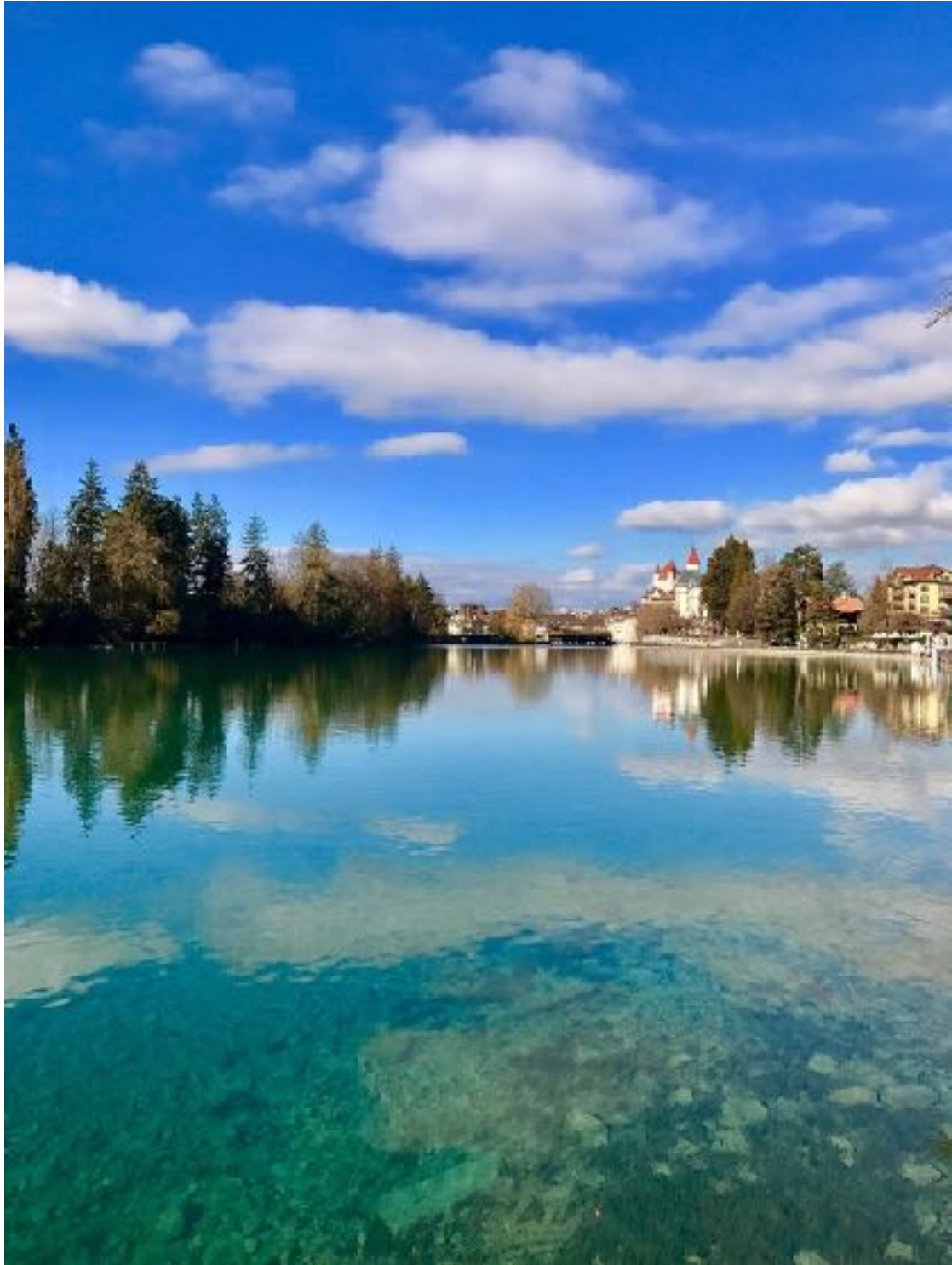
Thuner See mit Blick auf Thun 瑞士 我的家对面

Tue einfach, was dein Herz dir als richtig mitteilt. Dich in deinem Tun anderen zu erklären, ist Zeitverschwendung. Deine Freunde brauchen es nicht, und deine Feinde glauben es nicht.