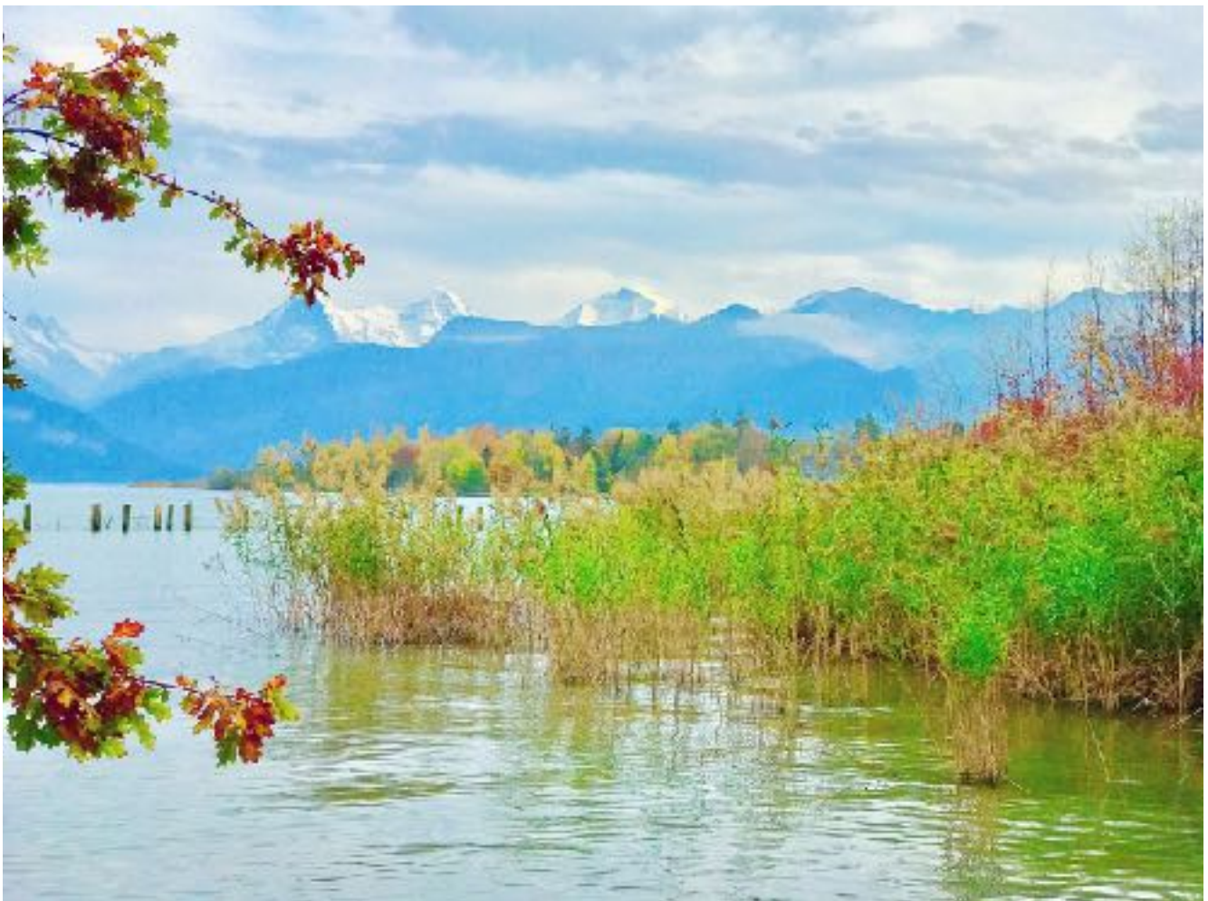
Gwatt am Thuner See 瑞士 我的家对面

In dieser Sache gibt es keine Eile. Was ernsthaft gemeint ist, woraufhin mit Bestimmtheit gelebt wird, das wird in aller Regel auch kommen, zur rechten Zeit, mit der richtigen Person, mit authentischen Beweggründen. Verliebe dich, wenn du dafür bereit bist, nicht wenn du einsam bist.