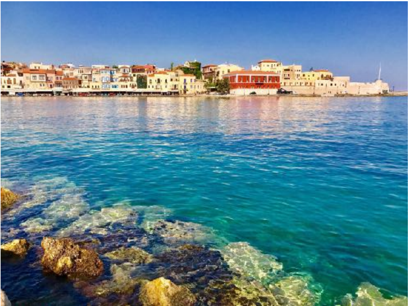
Chania auf Kreta 克里特岛。希腊

Eine der größten Herausforderungen im Leben ist, sich zu sich selbst zu bekennen, während man von außen ständig als irgendjemand behandelt wird. Irgendjemand wird immer schöner sein als du, oder gescheiter, oder jünger ... aber dieser jemand ist nicht du. Verbiege dich nicht, schaue nicht auf andere, sei du selbst. Gelingt dies, dann wirst du auch den richtigen Menschen begegnen, jenen Menschen, die von Natur mit dir zusammenstimmen. Deshalb der Anfang und das Ende von allem: Erkenne dich selbst.