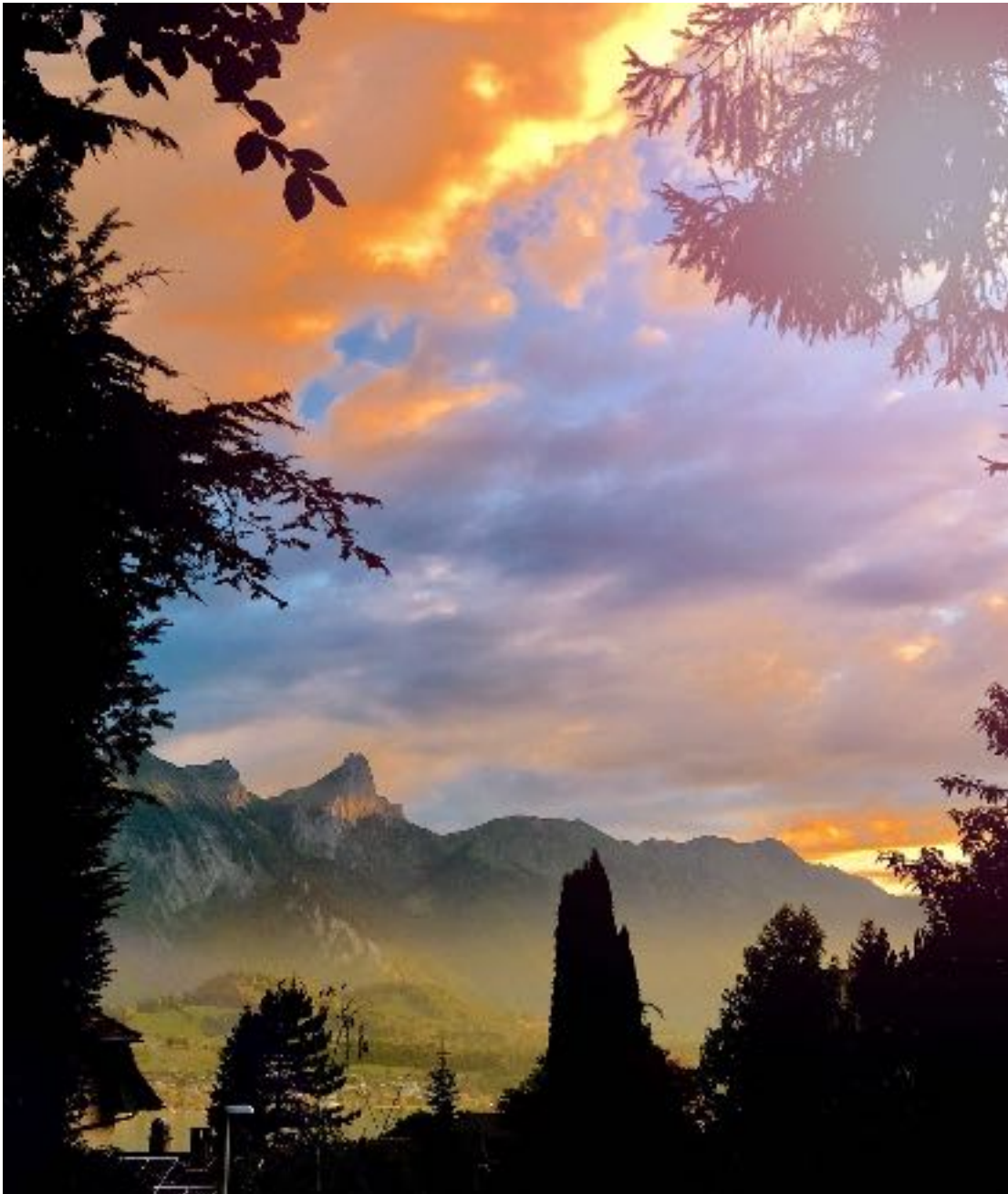
Stockhorn am Thuner See 瑞士 我的家对面

Etwas tun und dabei einen Fehler machen ist um ein Vielfaches besser als nichts zu tun. Jeder Erfolg hat eine Spur Mißerfolg hinter sich, ohne Mißerfolg kein Erfolg. Zu bedauern sind folglich immer nur Dinge, die du getan hast, niemals solche, die du nicht getan hast.