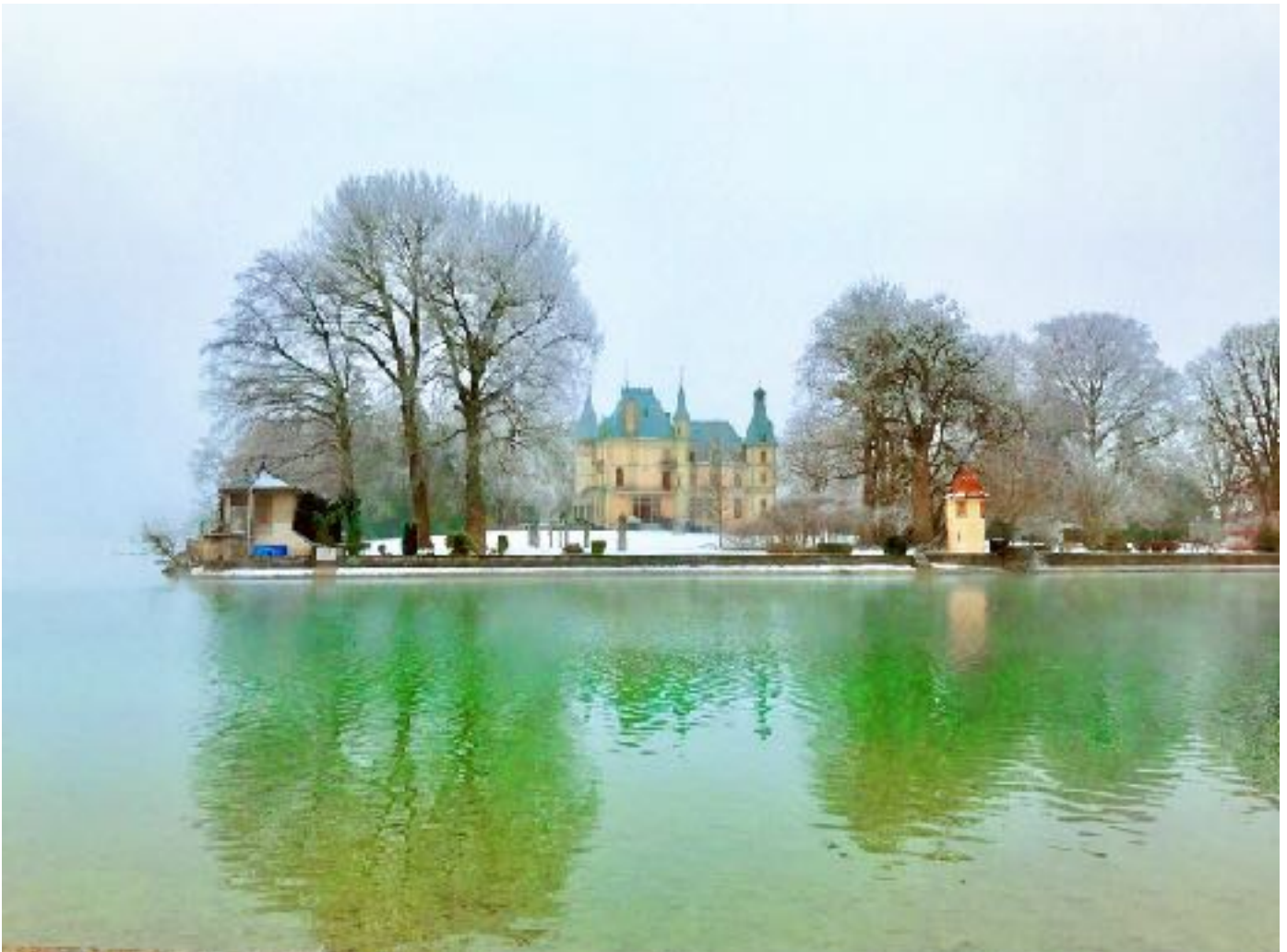
Schweiz Schloß Schadau am Thuner See 瑞士 我的家对面

Lebe nicht in der Vergangenheit. Wer zu sehr in Vergangenheit lebt, kann kein neues Kapitel in seinem Leben aufschlagen.