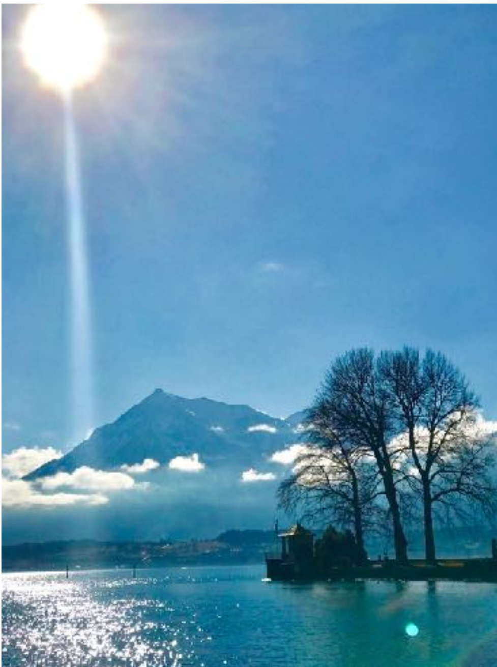
Niessen am Thuner See 瑞士 我家对面

Beachte und genieße auch die vermeintlich kleinen Dinge. Denn eines Tages wirst du zurückschauen und erkennen: diese kleinen Dinge waren die eigentlich großen. Die besten Anteile in deinem Leben werden die kleinen, namenlosen Augenblicke sein, die du lächelnd mit einem dir nahen Menschen verbracht hast.